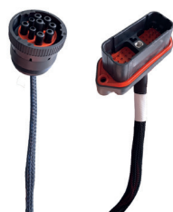
PŘÍPRAVA Z VÝROBY